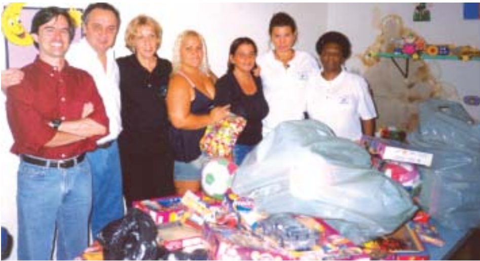
Representantes do CRC-RJ e Sescon-RJ presentes na entrega dos brinquedos em Belford Roxo