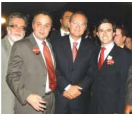
Senador Renan Calheiros recebe os pres. Nelson Rocha e Guilherme Tostes

A medida, que espera para ser apreciada pelo Congresso, causou impacto porque a grande maioria das empresas prestadoras de serviço é tributada por lucro presumido, já que as tributadas pelo lucro real são sujeitas ao regime de não-cumulatividade do PIS e da Cofins. Este