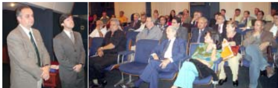
Lideranças contábeis debatem problemas e soluções para os escritórios