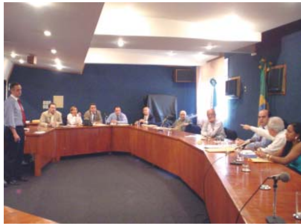
Secretários de Fazenda discutem os problemas enfrentados nos municípios

Ao final do encontro, ficou decidido que a periodicidade será mensal, entre os dias 10 e 20, e que na próxima reunião cada secretário levará a sua legis-