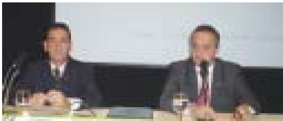
Os presidentes da Abamec e CRC-RJ abrem o simpósio