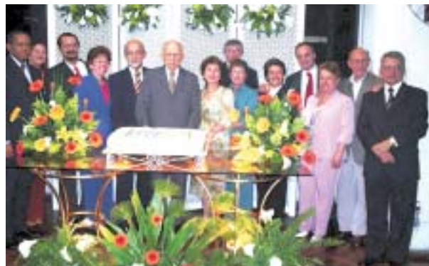
Diretoria e representantes de entidades cantam o parabéns