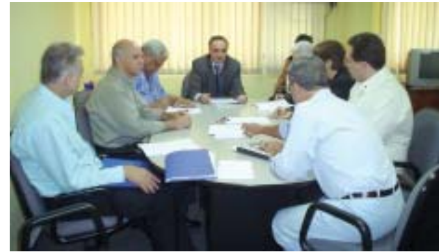
Avança a criação da Associação que reunirá os secretários de Fazenda dos municípios