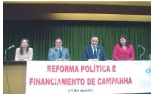
O público participou ativamente no debate do evento

foi a partir dessa lei que a participação do contabilista foi dispensada, passando o candidato a ficar responsável por toda a prestação de contas. Segundo ela, falta um código de processo eleitoral. "É preciso devolver a responsabilidade aos partidos políticos das campanhas de seus candidatos e o caráter contábil às prestações de contas das