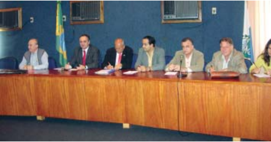
Controladores internos contabilistas de vários municípios estiveram na reunião realizada no CRC-RJ