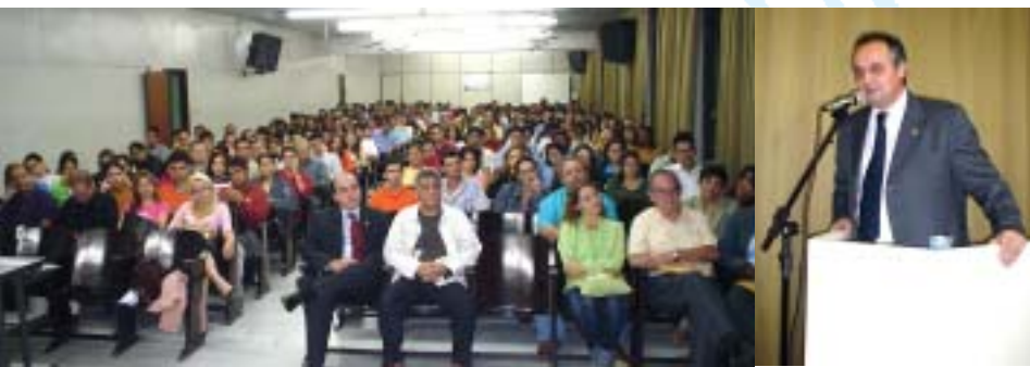
Em Barra Mansa, alunos dos cursos de Contábeis, Administração e Economia