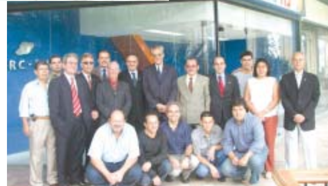
A agência Barra da Tijuca está situada no segundo piso do Shopping Città América, de frente para a Av. das Américas, onde os contabilistas da região serão atendidos