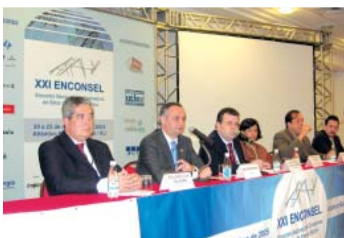
Contadores de todo Brasil do setor elétrico compareceram ao XXI Enconsel

O XXI Encontro Nacional dos Contadores do Setor de Energia Elétrica (Enconsel) foi realizado de 20 a 23 de novembro, na cidade de Búzios, no Centro de Convenções do Hotel Atlântico, sob a realização da Associação Brasileira dos Contadores do Setor de Energia Elétrica (Abraconee), com a participação de mais de 350 profissionais. Foram debatidos temas como o Encerramento Contábil do Exercício Social, a Harmonização