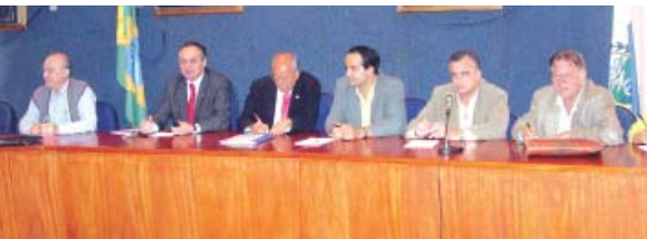
Controladores de vários municípios reuniram-se na plenário do CRC

No dia seguinte, 19 de outubro, houve a quarta reunião com os secretários municipais de Fazenda do Estado do Rio de Janeiro, em que os secretários que são contabilistas continuaram a conversa sobre a criação da Associação dos Secretários de Fazenda dos Municípios do Rio de Janeiro (ASSE-FAM).