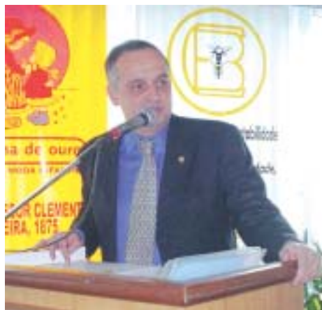
Lei Geral da MPE foi o tema da palestra em Bangu

Além de traçar um perfil das micro e pequenas empresas, o presidente abordou as principais inovações propostas