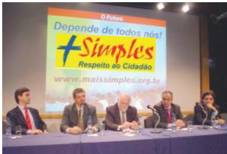
Superintendente da Receita Federal compareceu ao lançamento do + Simples e ouviu as críticas da categoria