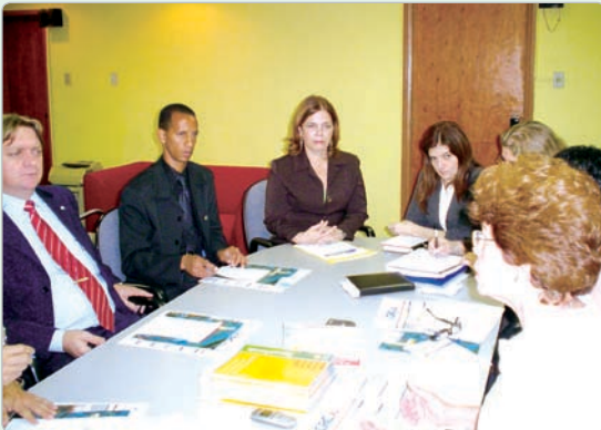
Representantes dos dois Conselhos se reúnem no CRC-RJ