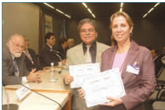
Os representantes das Indústria Granfino exibem os certificados