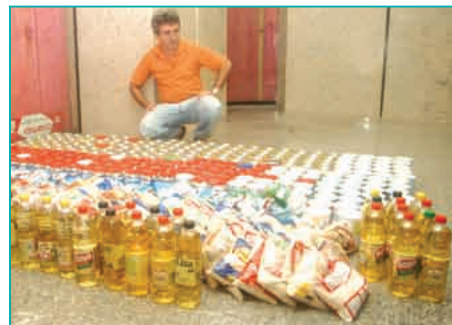
Foram arrecadadas mais de 2 toneladas de alimentos não perecíveis