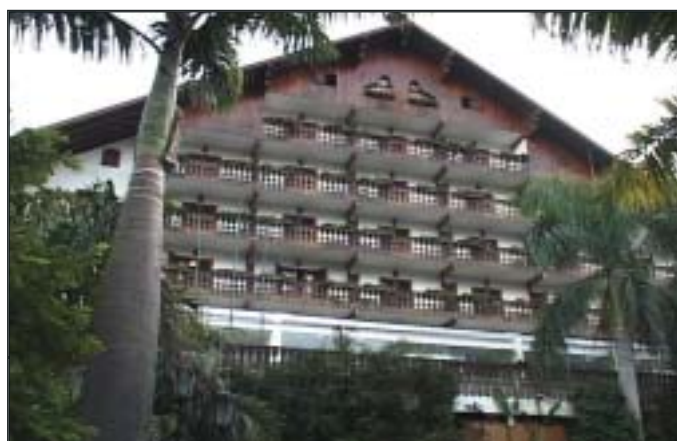
O Hotel Alpina, em Teresópolis, será o palco da 54ª Concerj

Durante os dias 1º, 2 e 3 de outubro deste ano, os profissionais e estudantes de contabilidade têm encontro marcado na 54ª Convenção dos Contabilistas do Estado do Rio de Janeiro (Concerj). O evento será realizado no Hotel Alpina, em Teresópolis, na Região Serrana, e tratará de temas relevantes para a profissão, como a harmonização contábil e suas implicações, além das principais inovações legais e tecnológicas. Inscrições e informações disponíveis na página do CRCRJ na internet www.crcrj.org.br .