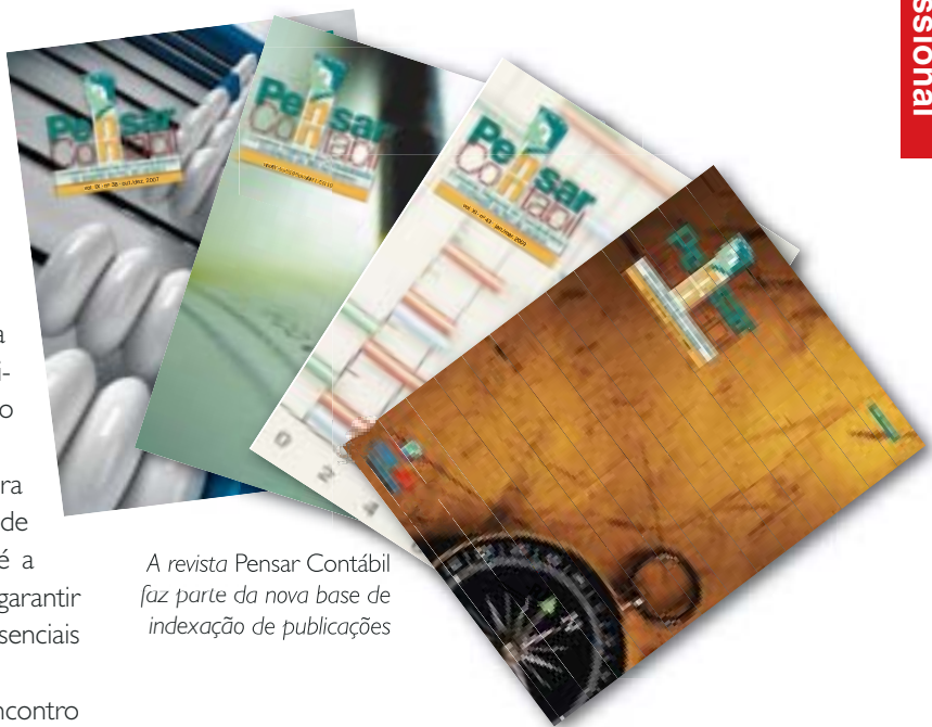
A revista Pensar Contábil faz parte da nova base de indexação de publicações