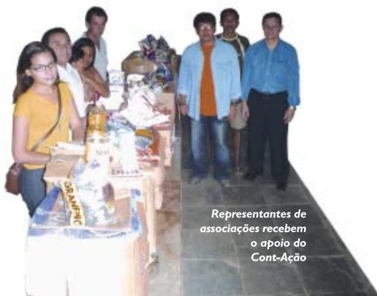
Representantes de associações recebem o apoio do Cont-Ação