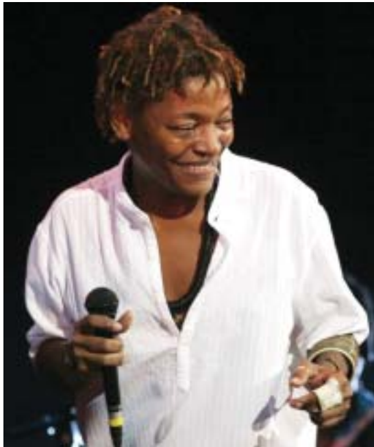
Mart'nália é a principal atração do evento de 2009

A edição deste ano do Show do Contabilista promete muita animação. Repetindo a receita de sucesso dos últimos dois anos, o samba no pé vai tomar conta do público, que irá se divertir ao som da cantora e compositora Mart'nália e da bateria da Escola de Samba Unidos de Vila Isabel. Promovido pelo CRCRJ, o evento será realizado no dia 16 de setembro no Citibank Hall, na Barra da Tijuca. O objetivo é proporcionar uma grande comemoração do Dia do Contabilista, celebrado em 25 de abril.